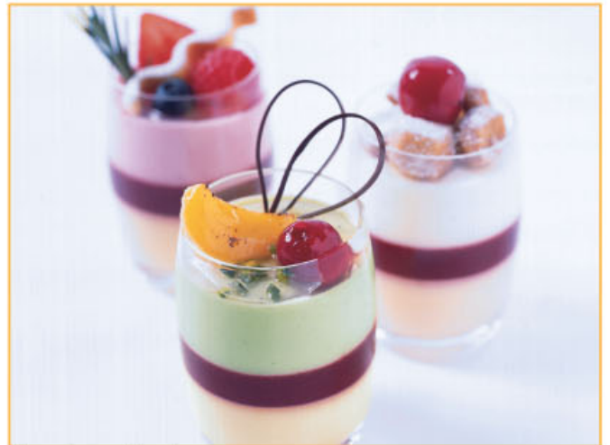
Pour environ • 12 verrines