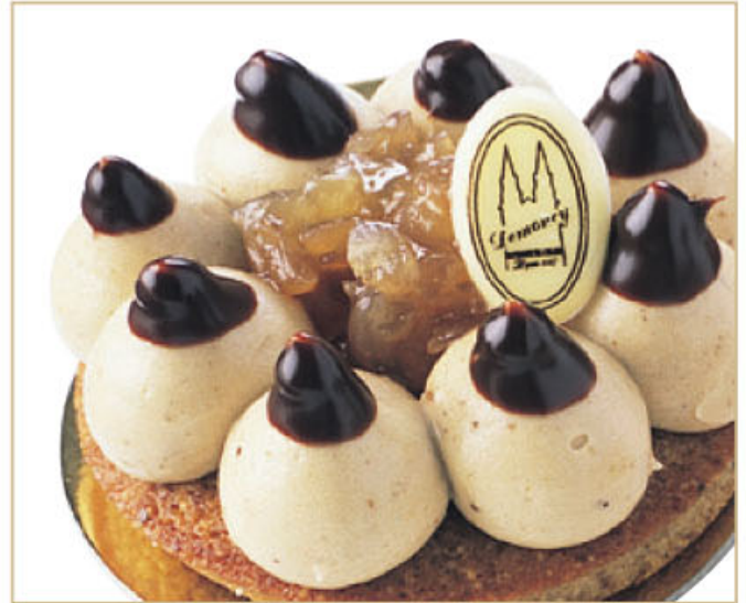
Recette pour environ • 24 pièces diamètre 8 cm soit 56 g pièce.